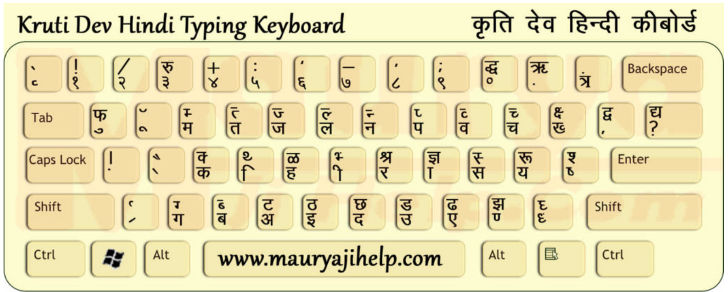
Kruti Dev Hindi Typing Keyboard Layout

नीचे आपको Kruti Dev Hindi Keyboard Layout का फोटो (Image) दिया गया है | Krutidev keyboard Chart.